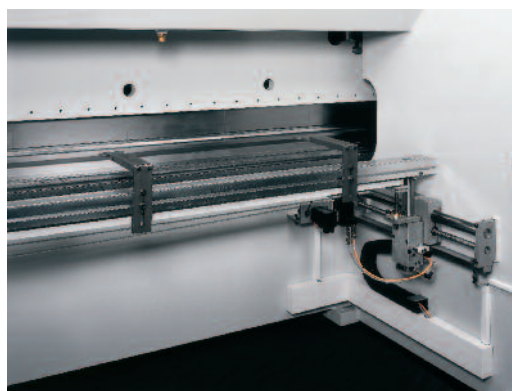
La butée arrière X-R

Le positionnement précis du coulisseau qui détermine l'angle de pliage (Y) et celui de la butée arrière qui positionne la tôle (X et R) sont obtenus par l'introduction à l'écran tactile des valeurs « \alpha et l » : en degrés pour l'angle, en mm pour la valeur du bord plié.